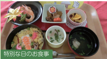
特別な日のお食事

毎日、美味しいお食事を準備しています。イベント・行事などの時は日頃と違って少し豪華なお食事を提供しています。