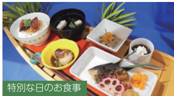
特別な日のお食事