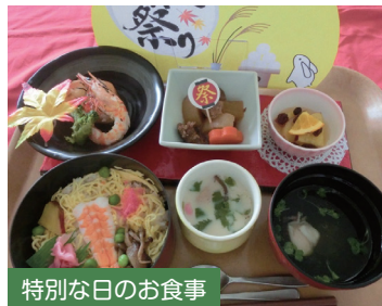
特別な日のお食事

毎日、美味しいお食事を準備しています。イベント・行事などの時は日頃と違って少し豪華なお食事を提供しています。