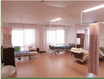
従来型特養 定員50名 4人部屋8室 個室18室

居室は、全て個室でゆったりとした時間をお過ごしいただけます。また、月1回・プロの板前が出張で、特別な料理をライブ調理してくれる出張料理などの特別なお楽しみイベントがあります。